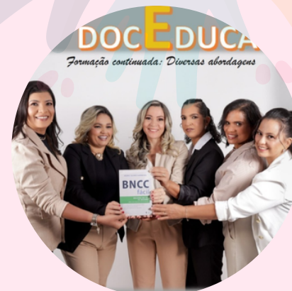
Doceduca Professoras e Formadoras de Educação Infantil